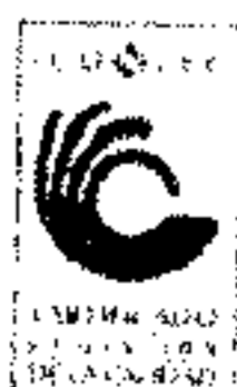
ALGIDES TOBON ECHEVERRI Alcalde Municipal